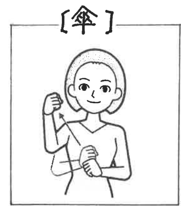
上下につけた両手拳の右手拳を上へ上げる