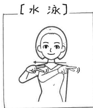
右手掌を下にした右手2指を交互 に上下させながら右へ移動する