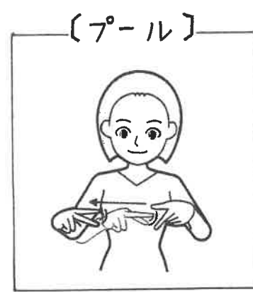
開いた左手2指の内側で右手2指 を上下させながら右へ移動する