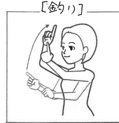
両手人差指を伸ばし「しづなび」合わせ、振り上げる