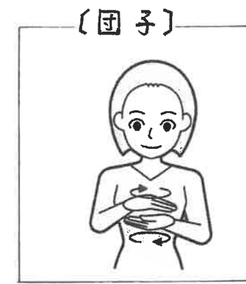
【団子】 両手掌を近づけて向き合わせ、水平に回し合う