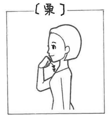
【栗】 右手拳を顎をこするように2回下ろす