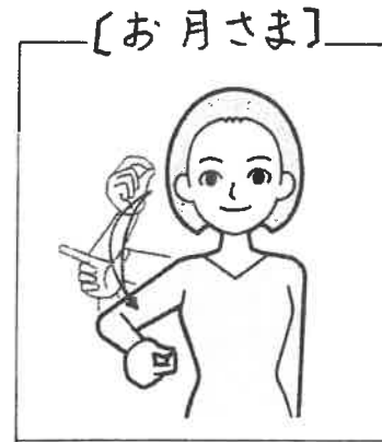
【お月さま】 右手2指で「三日月」の形を描く