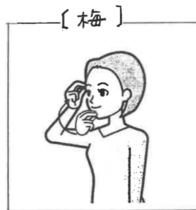
唇の下につけた右手3指のつまみをこめがみにつける