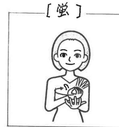
人差し指を曲げた左手と右手をせ親指と4指を開閉して移動する