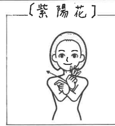
軽く指を曲げた左手掌の上を右手親指と4指を開閉させて回す