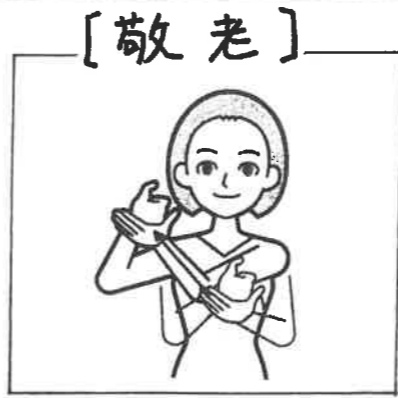
左手掌に親指を曲げた右手をのせて右上へ上げる