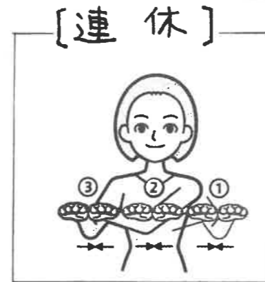
両手の人差し指側をつける動作を右へ移動しながら繰り返す