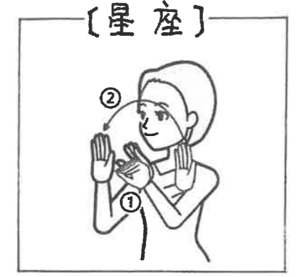
左手5指のつまみを開いた後方で右手掌を前に向け、半円を描く