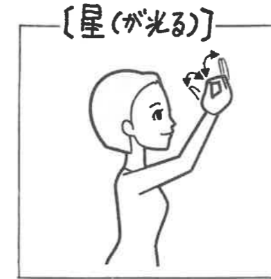
右手5指のつまみを頭より高く上げて指の開閉を繰り返す