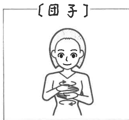
【団子】 両手掌を近づけて向き合わせ、水平に回し合う