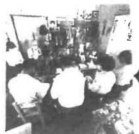
取材の様子、かぐれ