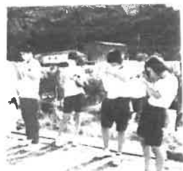
取材の様子、田野井花屋

7年目の「カレカぐれ」仲良し夫婦が定年後始めた。自分の家のようにゆっくりしてほしい。