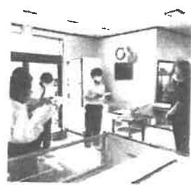
取材の様子、テリカブズくりやま

「テリカブズくりやま」創業101年の精肉店。先代の母の「ミニカブ」の味を受け継いでいる3代目。うれしかった事は「何年も会っていないお客さんが来てくれた事」中学生には「夢を持って、好きな事を自分が決めたい事は実行して」