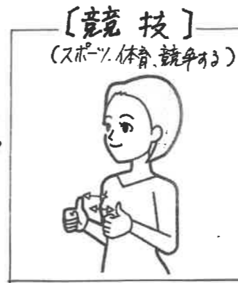
〔競技〕 (スポーツ、体育、競争あり) 親指を立てた両手を交互に前後する