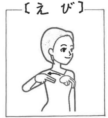
【えび】 折り曲げた右手2指を伸ば しながら右方に引く