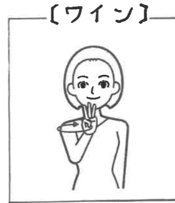
【ワイン】 立てた右手3指を口元で 水平に回す